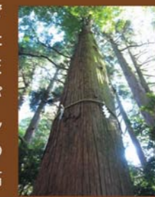
宮崎県高千穂神社のご神木

肥沃で固い地盤と、きれいで美味しい湧き水の地に育った木は、健康的でまっすぐに天高く成長します。円直で赤みが強く、経年とともに変化が楽しめます。宮崎県高千穂神社のご神木は樹齢800年で、樹高55mにもなる秩父スギです。