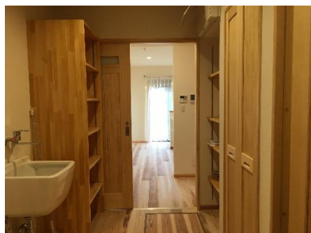
生活動線を考えた洗面所やパントリー