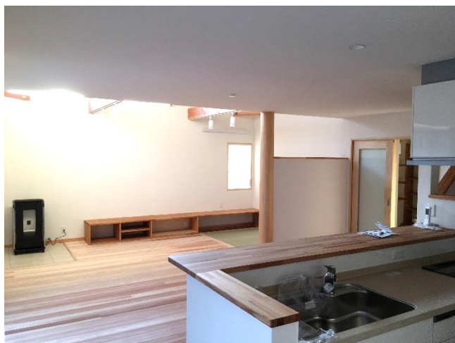
キッチンから見えるペレットストーブのあるリビング