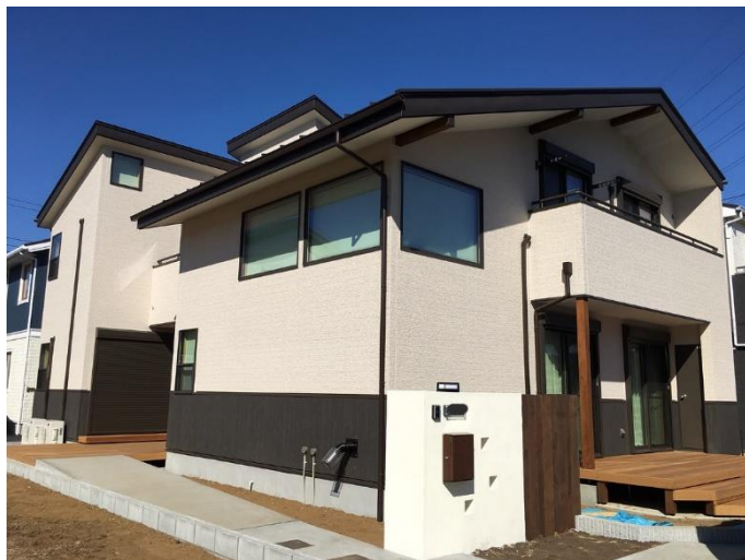
周りと同染むアイボリー色の外観