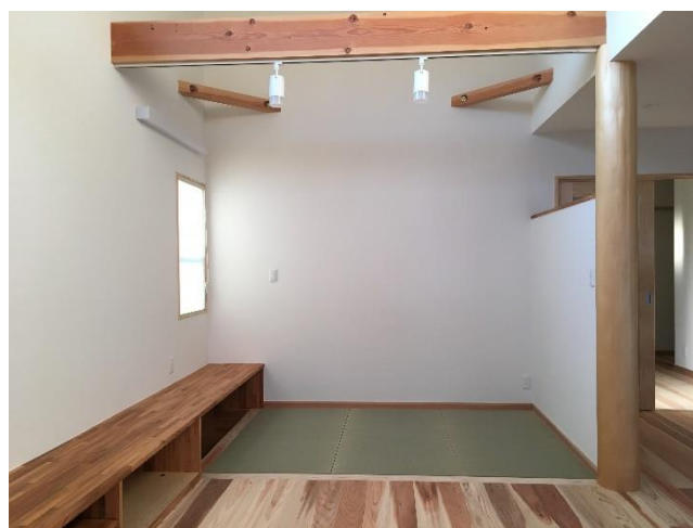
TVボードと一体になったカウンターテーブル。子供達の遊び場。