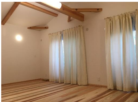
将来を考えて可変空間に仕上げた子供部屋。